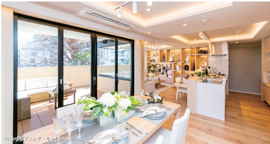
リビングダイニング・キッチン