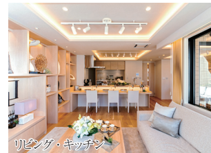
リビング・キッチン