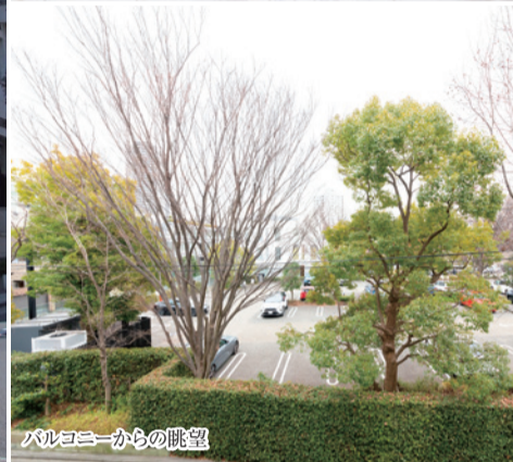
バルコニーからの眺望