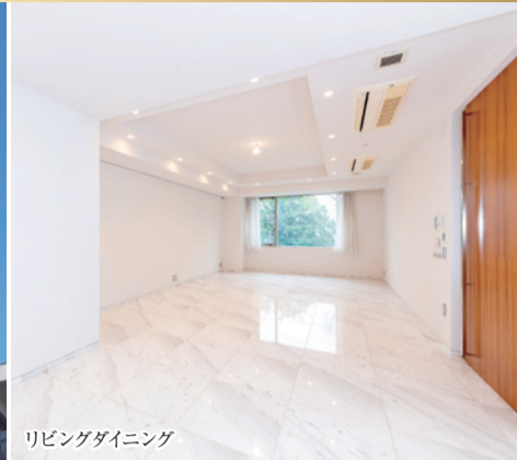
リビングダイニング