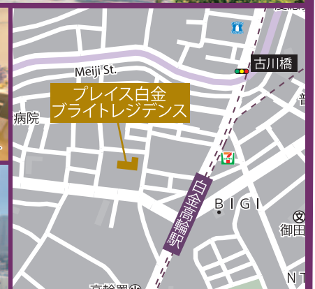
住所：港区白金1丁目25-11

●仲介物件につき成約の際に、当社規定の仲介手数料を別途申し受けます。●物件情報は2023年10月16日現在です。●広告有効期限:2023年11月12日。 ●Entrance:玄関●Shoes Closet:下駄箱・下足入●Hall:ホール●Living Dining:リビングダイニング●Storage・sto:収納・物入●Bed Room:洋室●Kitchen:キッチン●Lavatory:洗面所●Toilet:トイレ●Corridor:廊下●Clo:収納●Balcony:バルコニー●Bath Room:浴室 ①年間想定賃料収入は、満室時における1年間の想定賃料収入です(共益費などを含む)。②想定利回りは、年間想定賃料収入の当該不動産取得対価に対する割合です。③当社は、想定賃料収入が確実に得られることを保証するものではありません。④想定利回りは、表面利回り(公租公課・共益費その他当該物件を維持するために必要な費用の控除前)のものです。⑤利回りとは、当該不動産の一年間の想定賃料収入の、その不動産の価格(取得対価)に対する割合です。