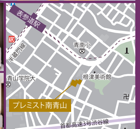
住所：港区南青山6丁目1-13