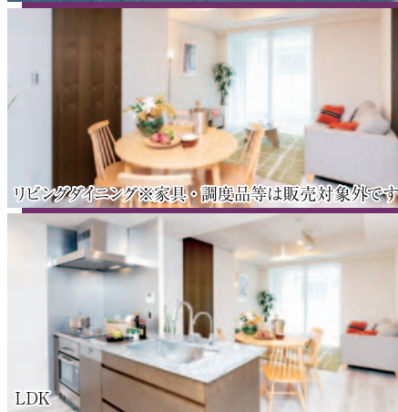
リビングダイニング※家具・調度品等は販売対象外です