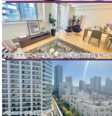
リビングダイニング※家具・調度品等は販売対象外です