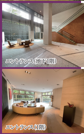
エントランス(地下1階)