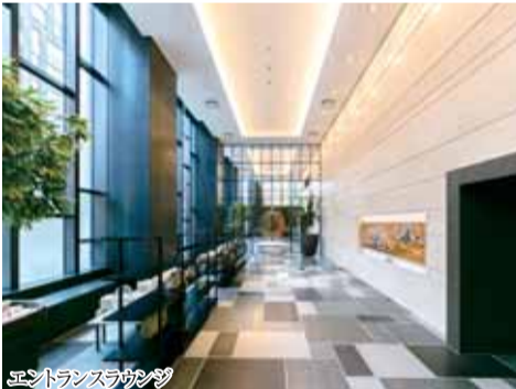
エントランスラウンジ