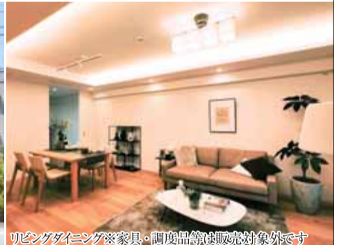
リビングダイニング※家具・調度品等は別売対象です