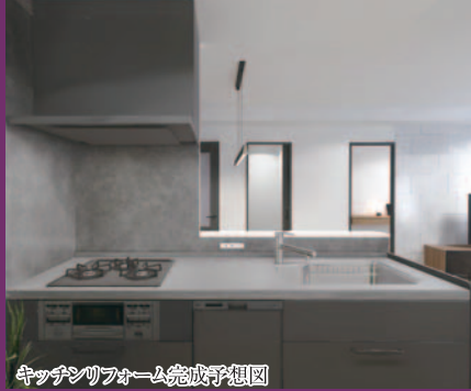
キッチンリフォーム完成予想図