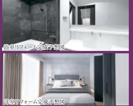
浴室リフォーム完成予想図