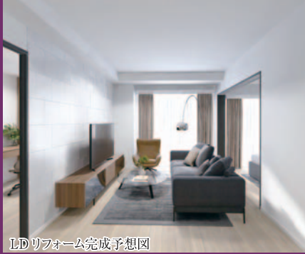
LDリフォーム完成予想図