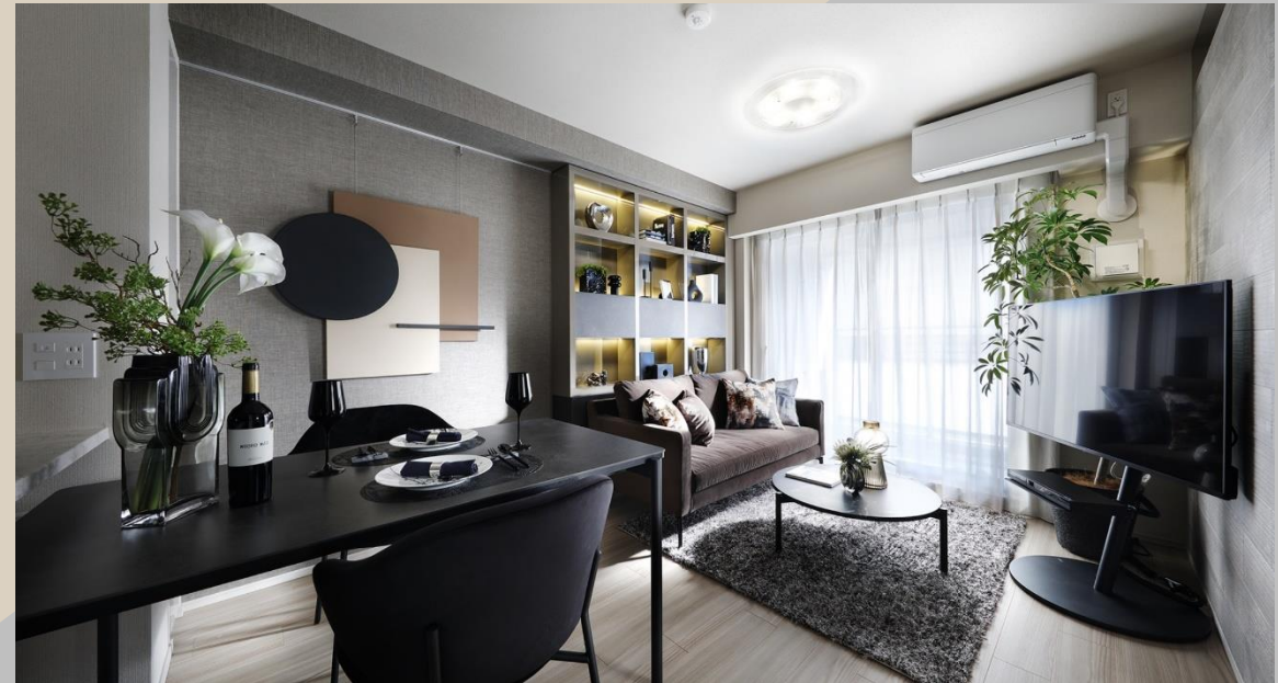
Living Dining Room