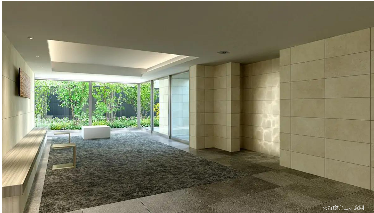
交誼廳完工示意圖

公共空間的設計包括交誼廳後方種植許多植栽， 搭配鳥鳴及潺潺流水的聲音及影像，讓人遠離都心喧囂。