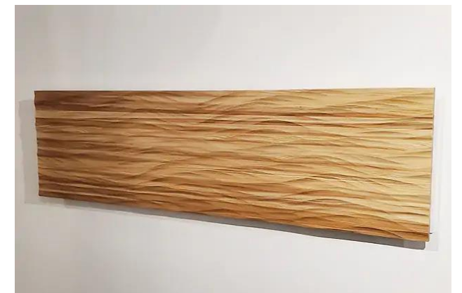
揚聲器 (Galaxy N10+) 參考照片