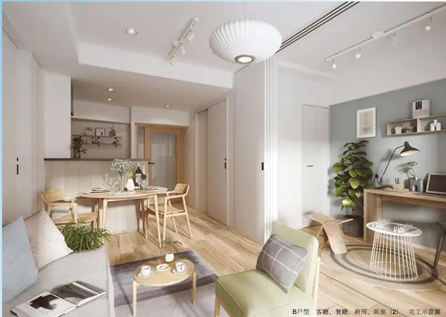
B戶型 客廳、餐廳、廚房、臥室 (2) 完工示意圖