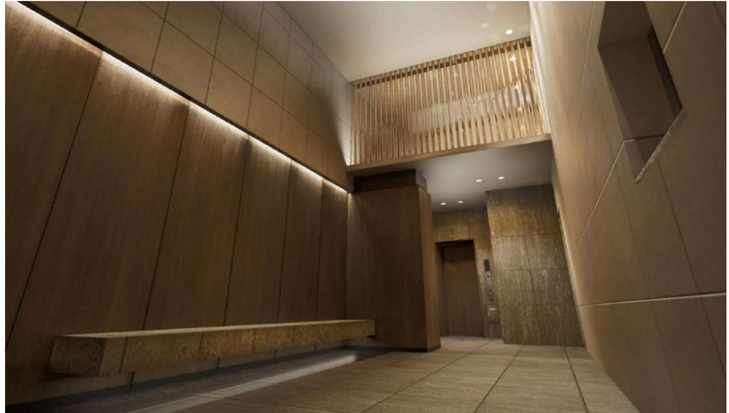
入口大廳完工示意圖