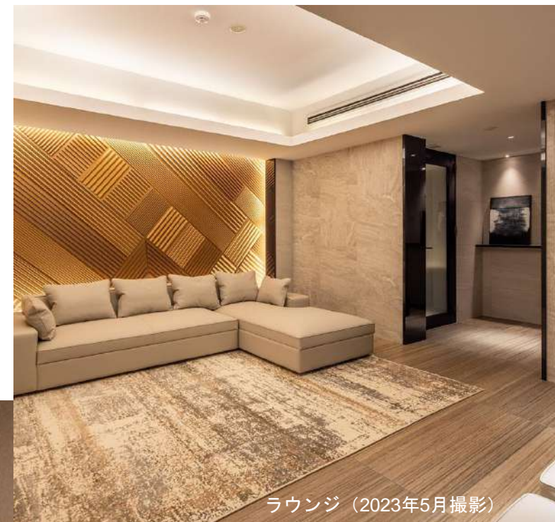
ラウンジ（2023年5月撮影）

ゆったりと寛げるラウンジの奥に、自分時間が過ごせる共用の個室スペース「+HANARE」を2室設置。 それぞれ仕切られた空間はサードプレイスとして様々な活用できます。