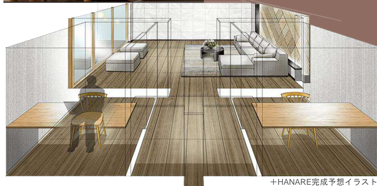
+HANARE完成予想イラスト

テレワークのほか資格や受験の勉強など1人で集中したい時。 気分転換として、少しの間家族と離れて読書や動画鑑賞など趣味の時間に没頭したい時。個室スペースの「+HANARE」なら、 誰の視線も気にならず自分だけの落ち着いた時間が過ごせます。