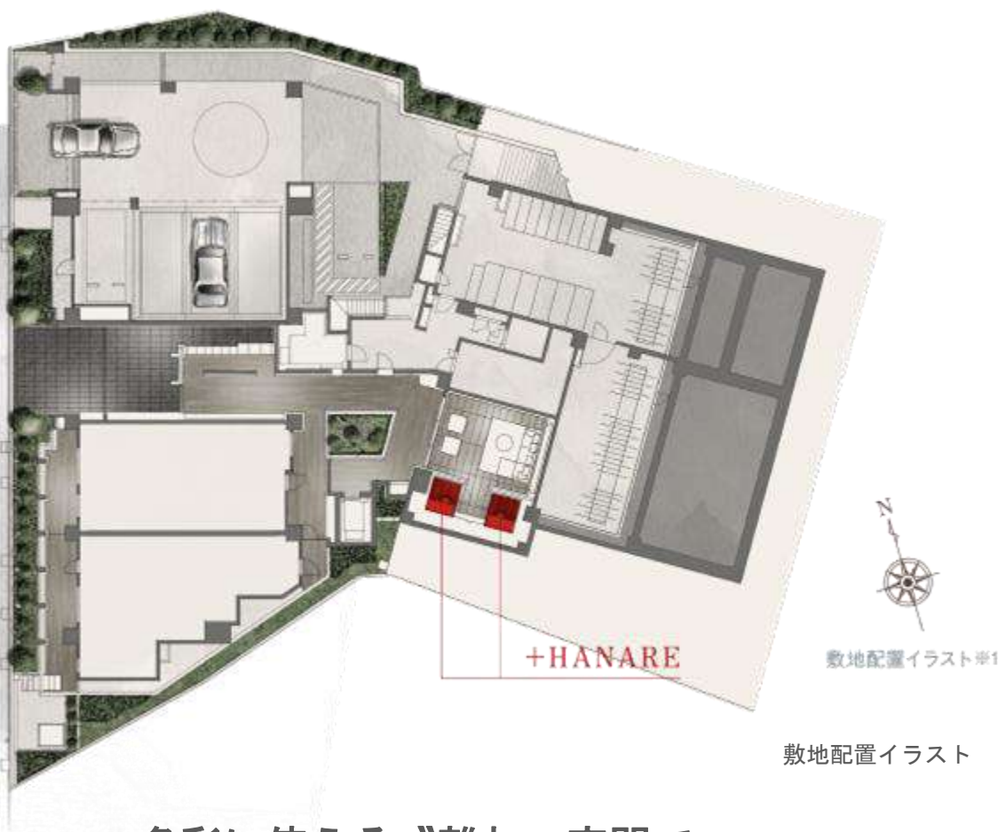
敷地配置イラスト