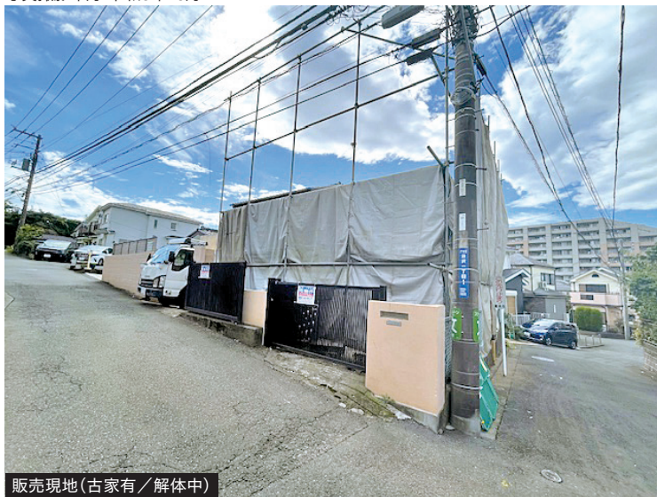
販売現地(古家有/解体中)