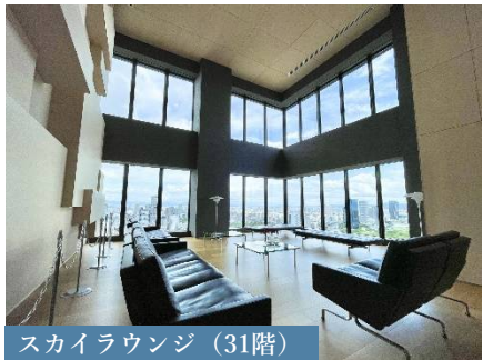
スカイラウンジ（31階）

【物件番号】C27248092 【物件概要】 ●所在地/大阪市中央区谷町2丁目 ●交通 /Osaka Metro谷町線「天満橋」駅徒歩 2分・Osaka Metro中央線「谷町四丁目」駅徒歩 5分●専有面積 /45.80 m 2 ●バルコニー面積 /4.71m 2 ●建物構造/鉄筋コンクリート造地上42階建ての7階部分●築年月 /2021年 11月 ●管理方式/日勤●管理費/月額11,950円●修繕積立金/月額4,580円●その他費用/インターネット使用料月額1,078円●引渡可能年月 /相談●現況 /空室 【取引態様】媒介（仲介）