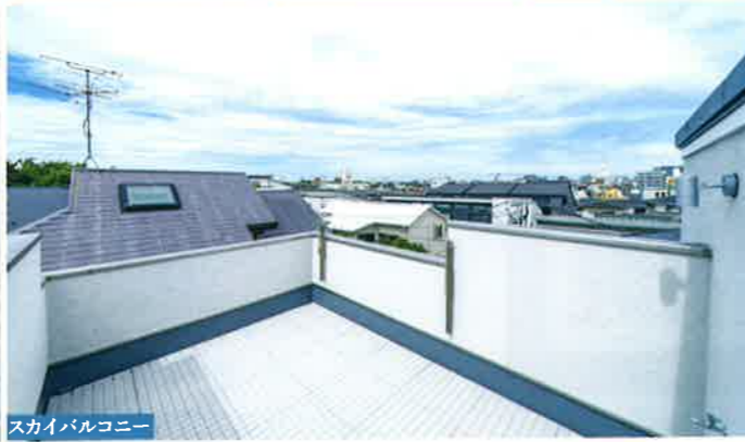
スカイバルコニー