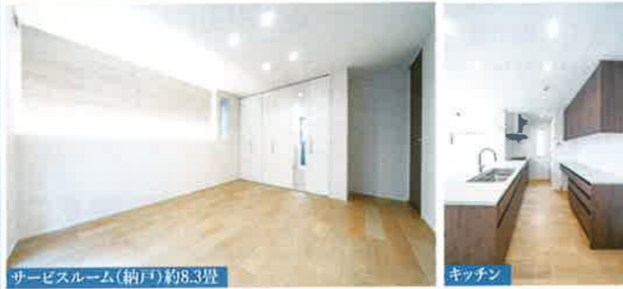
サービスルーム(納戸)約8.3畳