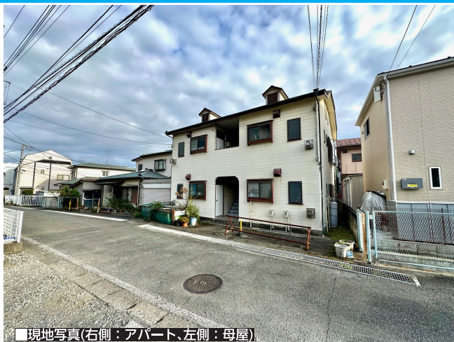
■現地写真(右側：アパート、左側：母屋)