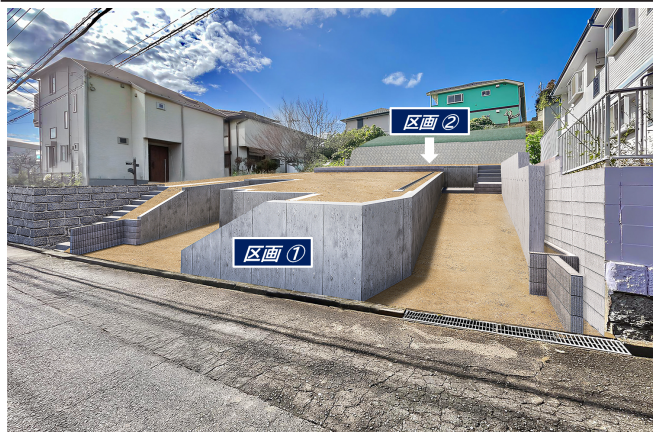
【造成完成予想図】 ※図面に基に描いたもので、実際とは多少異なる場合があります