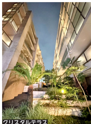
クリスタルテラス