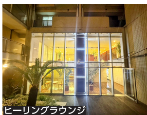
ヒーリングラウンジ