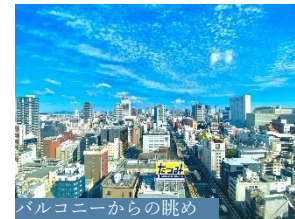
バルコニーからの眺め

【物件番号】 C2724X264 【物件概要】 ●所在地/大阪市西区南堀江1丁目 ●交通/Osaka Metro四つ橋線「四ツ橋」駅徒歩4分 ●専有面積/70.98㎡ ●バルコニー面積/4.53㎡ ●サービスバルコニー面積/7.17㎡ ●構造・階数/鉄筋コンクリート造地上35階建の21階部分 ●築年月/2014年2月 ●管理形態/全部委託 ●管理員の勤務形態/日勤 ●管理費/月額16,300円 ●修繕積立金/月額9,580円 ●その他費用/インターネット利用料月額1,067円 ●引渡可能年月/相談 ●現況/居住中 【取引形態】 媒介（仲介）