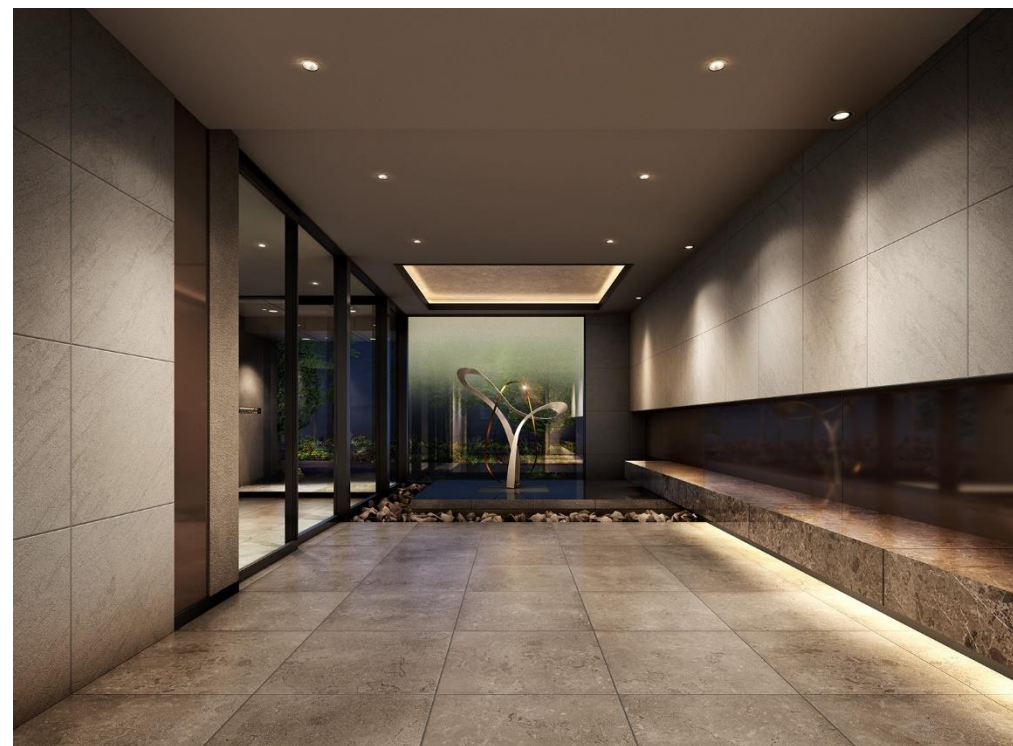
入口大廳完工示意圖