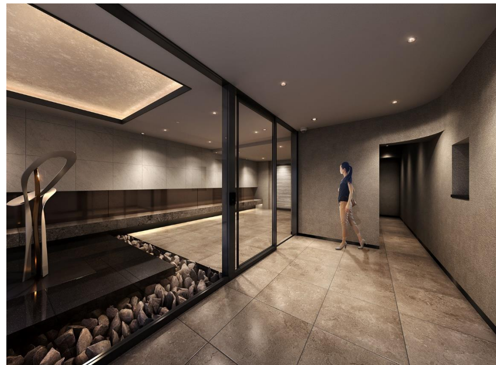
入口處完工示意圖