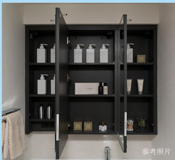
三面鏡後收納空間

無論是雨天或夜間都可以輕鬆烘乾衣物。此外還具備冬季取暖功能與舒適的送風系統，讓浴室環境更加宜人。