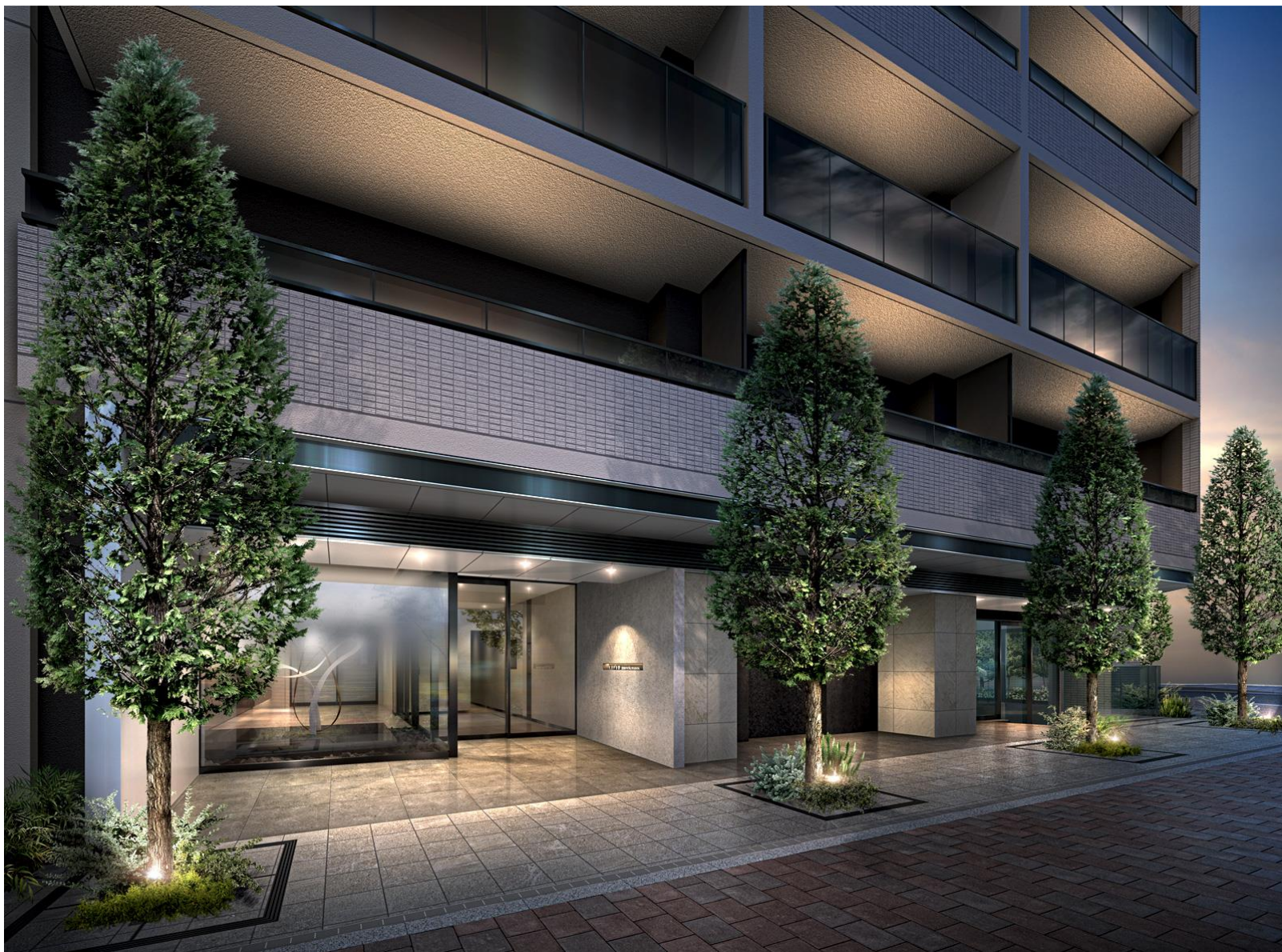
大門入口處完工示意圖