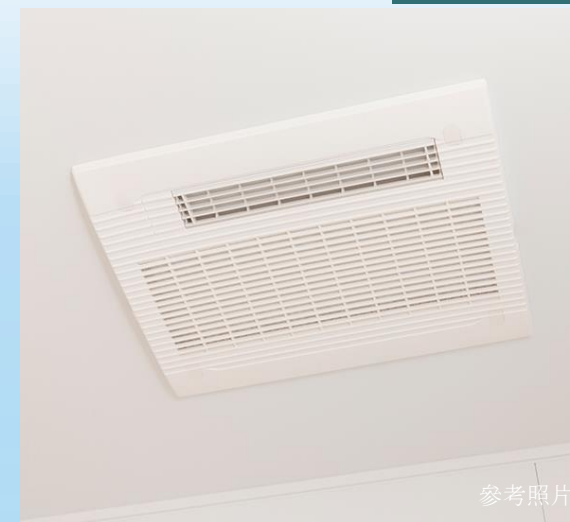
TES式浴室暖房乾燥機

基於人體工學的研究設計，增加支撐身體的接觸面，追求穩定的入浴體驗。與傳統浴缸相比，能分散對關節的壓力，溫柔地包覆和支撐身體，使入浴時更安心放鬆。