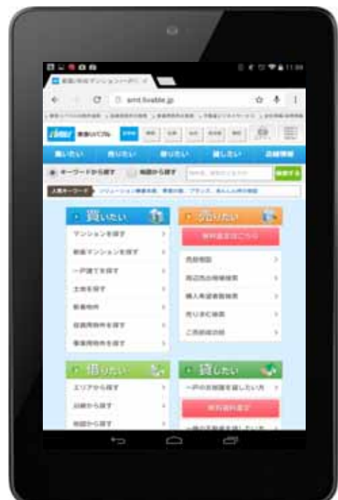
タブレットサイトのトップ画面