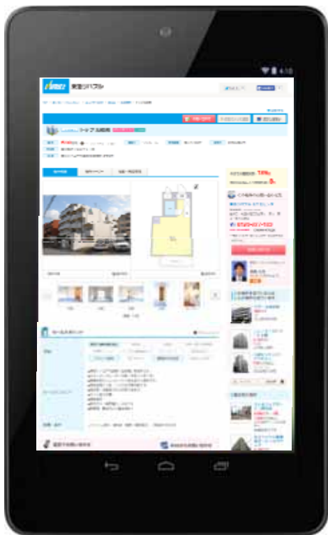
従来の物件詳細ページ（PC サイトを表示）