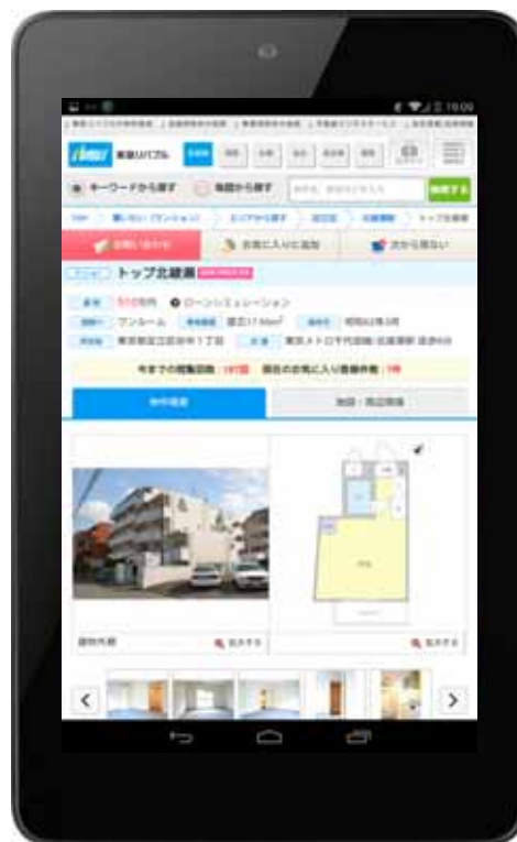
タブレットサイトの物件詳細ページ

東急リバブル ホームページ（PCサイト） http://www.livable.co.jp/