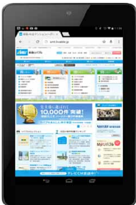
従来のトップ画面（PCサイトを表示）