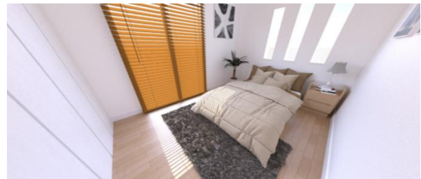
<家具を配置したVRによる室内画像>

また、当社がVR制作会社への発注及び制作費用を負担するため、売主様にとっても費用等負担が無く、竣工前販売を促進させるサービスとなります。売主様、買主様の期待に応えるサービスを提供することで、新築建売住宅の販売受託(仲介)事業の拡大を図ってまいります。