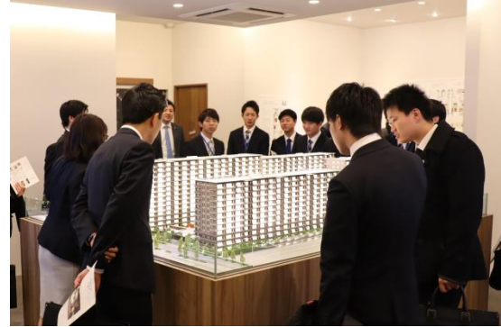
インターンシップの様子:当社の業務を知るグループワーク(左)と新築マンションのモデルルーム見学(右)