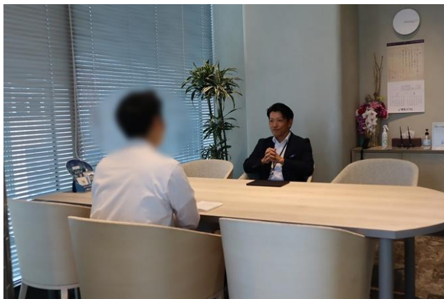
▲流通事業本部 管理職との打ち合わせの様子