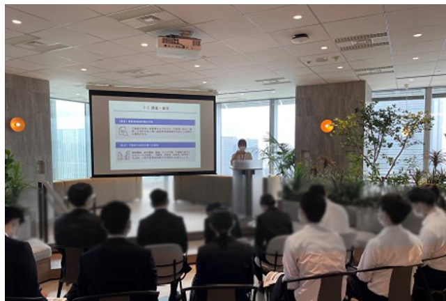
▲ソリューション事業本部 オリエンテーションの様子