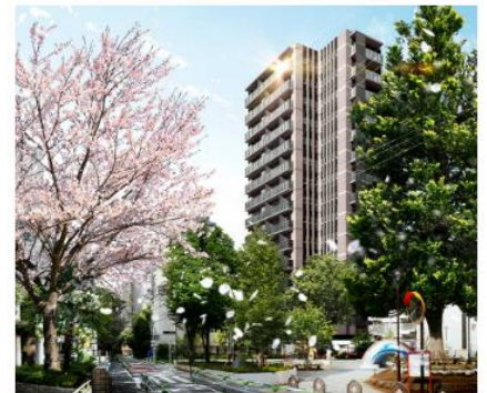
ルジェンテ文京湯島 (外観完成予想CG)