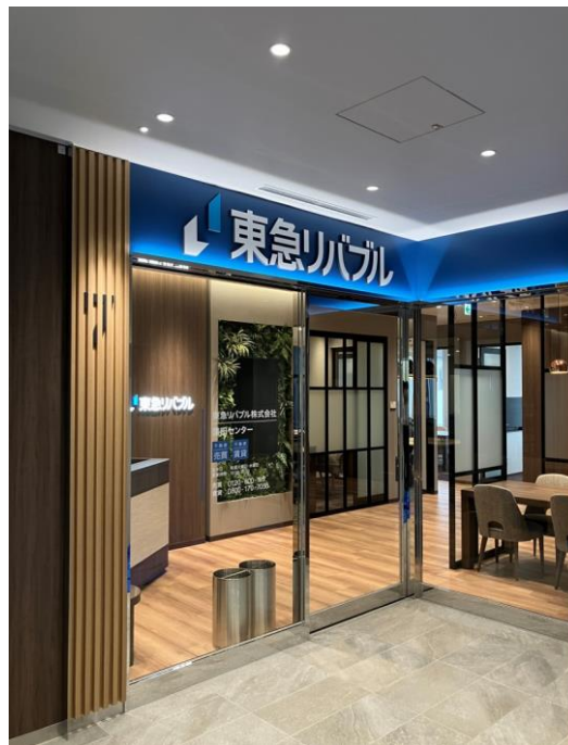
▲蒲田センター エントランス

JR 京浜東北線、東急池上線、東急多摩川線の3路線が利用できる「蒲田」駅は、品川駅や東京駅など、東京都内の主要エリアへの移動が30分圏内であることに加え、JR 大宮駅まで乗り換えなしでアクセスも可能。また、JR 蒲田駅から徒歩圏内にある「京急蒲田駅」を利用することで、羽田空港へのアクセスも可能になるなど、交通利便性の高いエリアです。古くから繁華街として知られる蒲田は、2つの駅ビルや商店街があり、スーパーやファッション、レストランや書店など店舗が充実しています。更に区役所や税務署などの公的機関や総合病院があるなど、生活利便性が非常に高いエリアであることも特徴です。