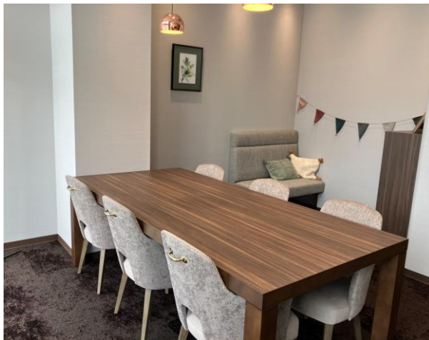
▲応接室（キッズルーム付き）

今後も当社はネットワークの充実と共に、お客様の課題に真摯に向き合い、最適な解決へ導けるよう努めてまいります。