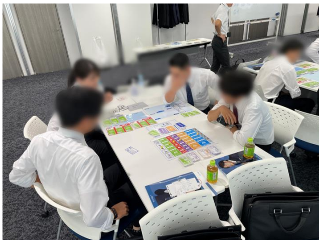
▲経営シミュレーションボードゲームの様子