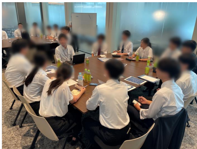
▲ソリューション事業本部 社員座談会の様子